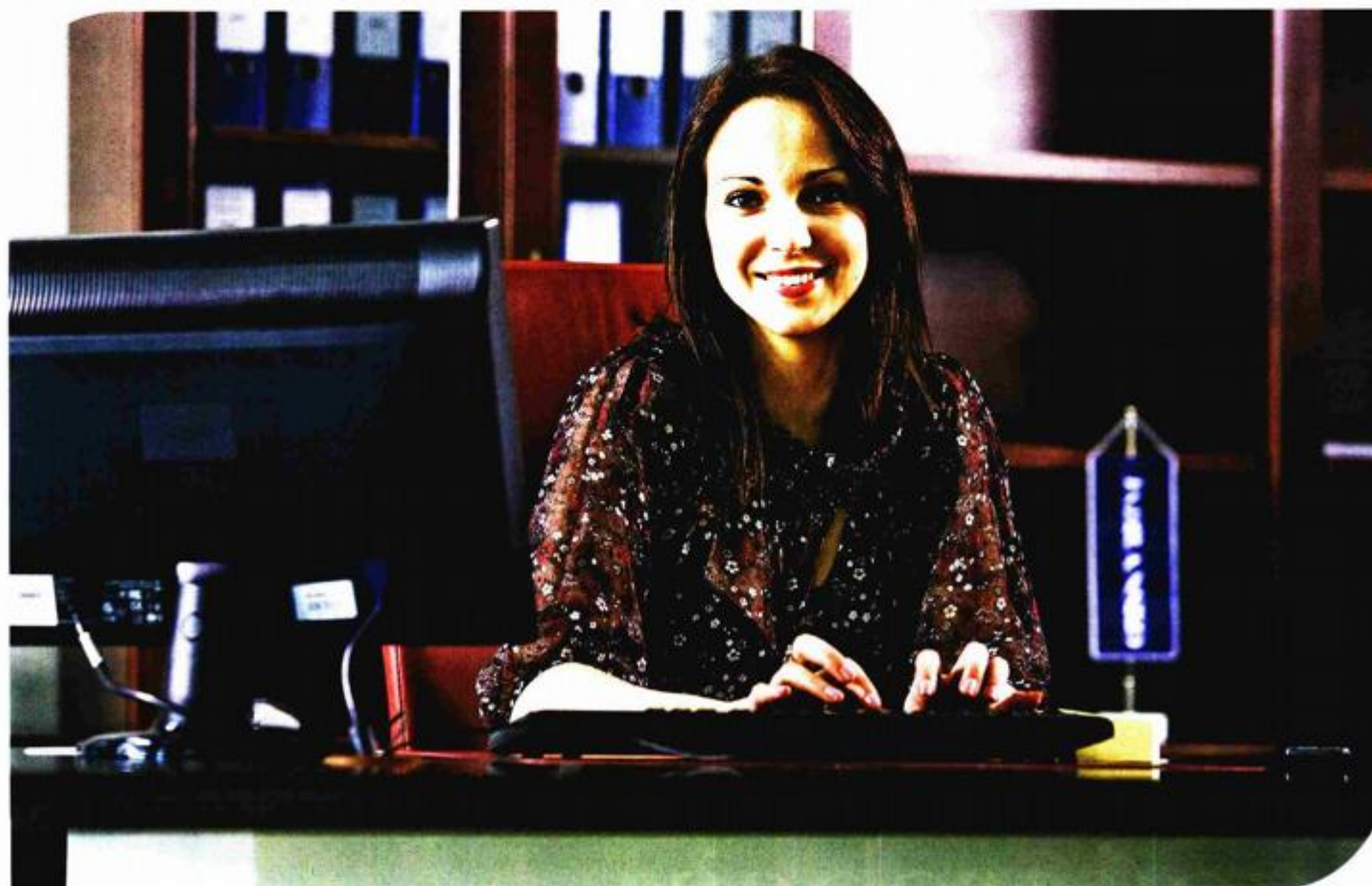
Mladi, obrazovani i ambiciozni djelatnici glavni su pokretač poslovanja Jadranskog osiguranja