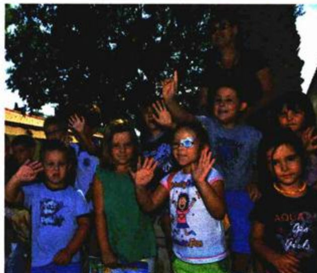
Postira će živjeti i dalje – djeca iz vrtića "Grdelin"

ra, smiješe se tako još bolji dani. Ovdje će se domalo vrtjeti velike turističke brojke.