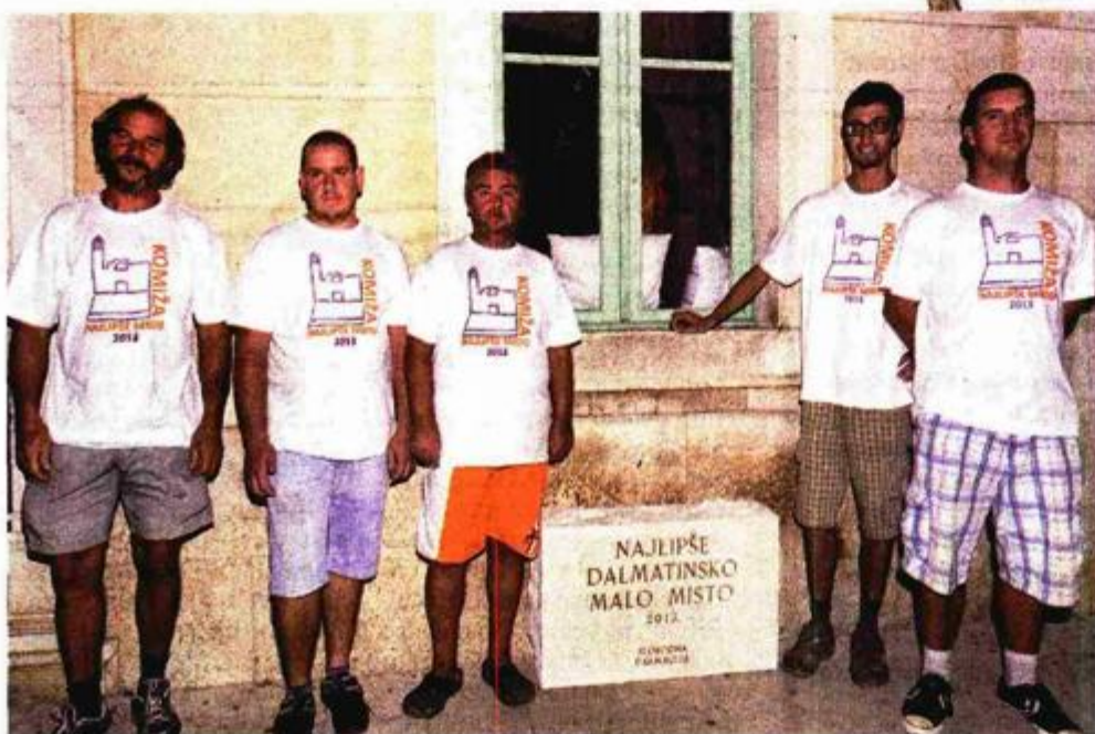
Petorica vrijednih komunalaca koji Komižu održavaju savršeno urednom