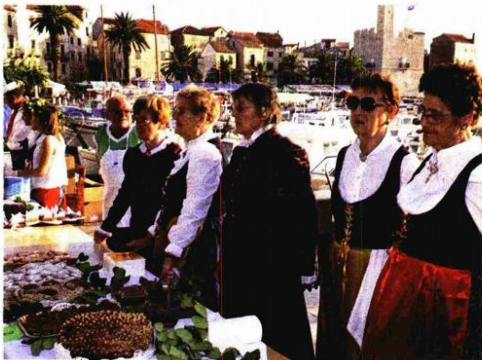
Dodjela je bila dio fešte Treći dani rogača i Večeri mješovitih klapa 47. omiškog festivala

u Jadranskom osiguranju, čestitala je Komiži i istakla je kako su i oni prepoznali vrijednost projekta Slobodne Dalmacije u kojemu su višegodišnji partneri. Trud rad i zajedništvo svih mogu uroditi plodom, što se ovdje najbolje vidi - istakla je Čurčić. U Komiži je i ovih dana veliki broj turista, a dodjela priznanja bila je dio fešte Treći dani ro-